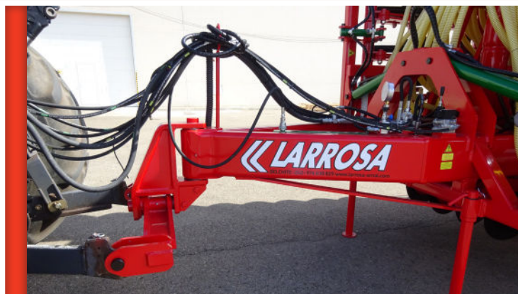
Enganche articulado a los dos puntos del tractor, muy robusto y que permiten una gran maniobrabilidad

SEBRADORAS HOMOLOGADAS PARA CIRCULAR LEGALMENTE POR CARRETERA