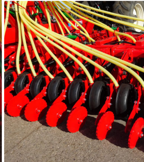
Ruedas onduladas "aprieta semilla" que dejan un surco para facilitar la siembra segura.