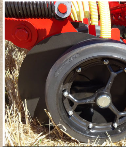
Ruedas de radios, que permite situaciones de mucha humedad.