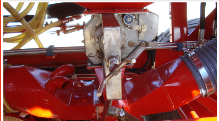
Distribuidor de acero inoxidable y turbina

Ahora también en Facebook e Instagram: @sembradoraslarrosa