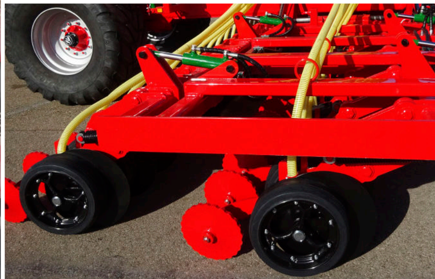
Sistema hidráulico para regular la presión de los discos y para elevarlos a la hora de hacer maniobras.