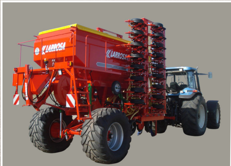
Máquina en posición de transporte-3m.