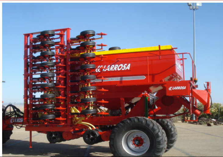
Sinfín trasero plegable