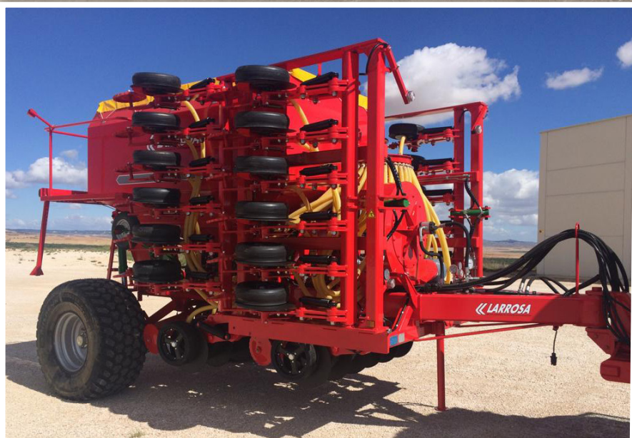
Máquina en posición de transporte-3m.