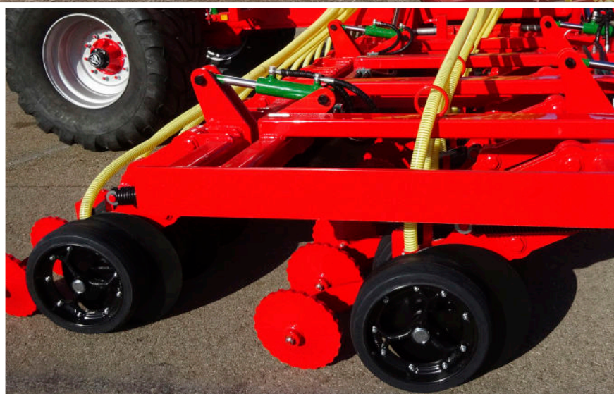
Sistema hidráulico para regular la presión de los discos y para elevarlos a la hora de hacer maniobras.