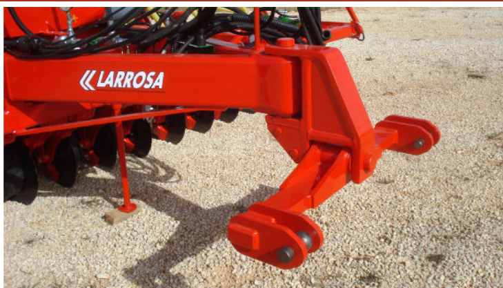
Enganche articulado a los dos puntos del tractor, muy robusto y que permiten una gran maniobrabilidad

SEBRADORAS HOMOLOGADAS PARA CIRCULAR LEGALMENTE POR CARRETERA