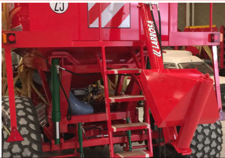
Sinfin trasero plegable