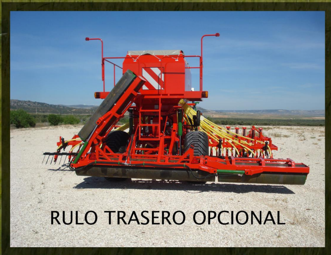
RULO TRASERO OPCIONAL